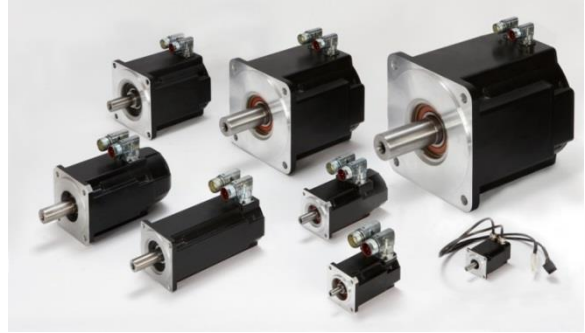
Kollmorgen, AKM™ servo mekanizmalar: 8 ebatla gelir, mükemmel mekanizma için motor

Motor konusunda geniş AKM™ Servo Motorları ürün gamı tıpkı AKD-N Servo Sürücüler gibi, C.M.C.'nin bu projede Kollmorgen'ı ortak olarak seçmesine katkıda bulunmuştur: AKM™ Servo Motorlar, temelde sınırsız sayıda konfigürasyona sahiptir ve bu sayede en üst seviye performans ve mükemmel bir güç yoğunluğunun yanı sıra görülmemiş seçim ve esnekliğe imkan tanır. Tak-çalıştır motor tanıma ve kendi kendini ayarlama özellikleri sayesinde, AKD™ servo mekanizmaların kolayca kurulduğundan ve kullanılabilirliğinden bahsetmek de gerekir.