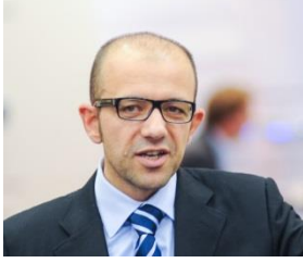
Yazar: Kıdemli Satış & Kilit Müşteri Yöneticisi, Kollmorgen İtalya, KOLLMORGEN Italia

sağlayan, bir çözüm üretmemize imkan verdi. Neredeyse bir kilometreden fazla kablo tasarrufu ettik. Umarım, hep beraber yeni mücadeleleri aşmak için zamanı yakalamamızı sağlayan artı değer ile çalışmaya devam ederiz.