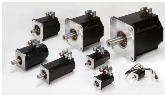
AKM™ Servomotoren von Kollmorgen: in acht Baugrößen erhältlich – der Motor für den perfekten Antrieb

Im Hinblick auf die Motoren trug auch das breite Sortiment der AKM™ Servomotoren dazu bei, dass C.M.C. sich für Kollmorgen als Partner bei diesem Projekt entschied: Die AKM™ Baureihe bietet eine nahezu unbegrenzte Anzahl von Konfigurationen, einzigartige Auswahlmöglichkeiten und Flexibilität sowie führende Leistung und eine ausgezeichnete Leistungsdichte. Ebenfalls anzumerken ist, dass sich die selbstjustierenden AKD™ Servoverstärker mit Plug-and-Play-Motorerkennung einfach in Betrieb nehmen lassen.