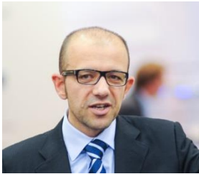
Autor: Senior Sales & Key Account Manager, KOLLMORGEN Italia