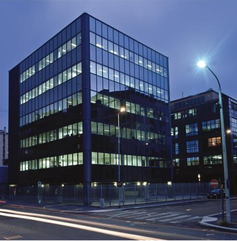
Mondial Spa'nın merkez ofisi - Milano

Endüstrinin birçok sektöründe faaliyet gösteren makineler, KOLLMORGEN lineer motorları ile çalışan konumlandırma ünitelerinin performansından, güvenlik standartlarından, boyutlarından ve hassasiyetinden istifade etmektedir.