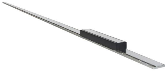
KOLLMORGEN Direct Drive Linear Motor